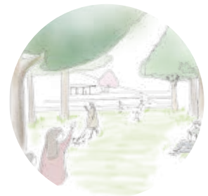
更地は広場になり、みんなの居場所に