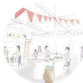
大屋根の下でイベントを行う